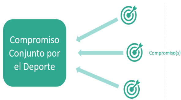
Gráfico 3: visión general del compromiso

Todo el mundo puede comprometerse. Cada organización o entidad que se compromete tiene su propio compromiso y en él se incluyen los detalles de las acciones que se implementarán como contribución hacia el Compromiso Conjunto por el Deporte 2023 y los cambios que van a comportar.